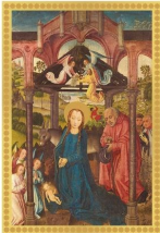
La Natividad. Maestro de Soperán. Museo Nacional del Prado. Madrid.