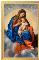
La Virgen con el Niño en la Gloria. Carlo Maratti. Museo Nacional del Prado, Madrid.